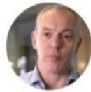
Frédéric Vallier CEMR SECRETARY GENERAL PLATFORMA

"Knowledge and skills are exchanged between people doing the same job, facing similar problems and looking for practical solutions."